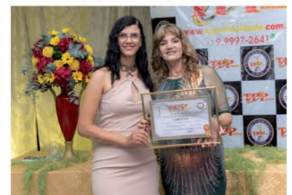
CORCELAN LANTERNAGEM, PINTURA E ACESSÓRIOS 42 ANOS DE MERCADO 15 ANOS DE DESTAQUE (TROFÉU DE OURO) RUA 1º DE MAIO, 348 - CENTRO FONE: (77) 3451-2761