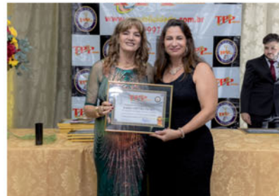
RÁDIO CULTURA FM 94,7 EMISSORA DE RÁDIO FM 44 ANOS DE MERCADO 17 ANOS DE DESTAQUE (TROFÉU DE OURO) AV. OTÁVIO MANGABEIRA, 1.026 FONE: (77) 3451-1348