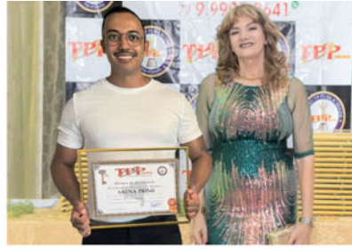
ARENA PRIME ACADEMIA 07 ANOS DE MERCADO 06 ANOS DE DESTAQUE (CHAVE DE OURO) RUA MAJOR FERREIRA, 144 - SÃO FRANCISCO FONE: (77) 9.9186-0609