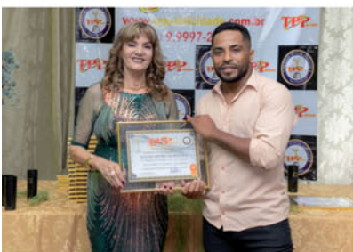
STATUS CENTRO DE ESTÉTICA SALÃO DE CABELEIREIRO 34 ANOS DE MERCADO 08 ANOS DE DESTAQUE (TROFÉU DE OURO) RUA JUSCELINO GOMES CARDOSO, 50 - CENTRO FONE: (77) 3451-2556