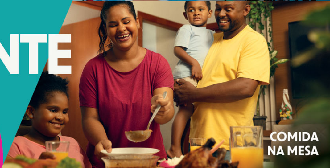
COMIDA NA MESA