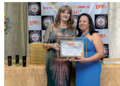
VILA BABY COM ÂNGULO "COLÉGIO QUI-MIMO" EDUCAÇÃO INFANTIL 42 ANOS PREPARANDO VENCEDORES 09 ANOS DE DESTAQUE (TROFÉU DE OURO) RUA 1º DE MAIO, 222 - CENTRO FONE: (77) 3451-2650