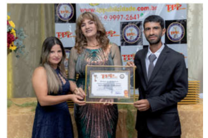
RENASCER TURISMO TRANSPORTE RODOVIÁRIO DE PASSAGEIROS SOB REGIME DE FRETAMENTO 03 ANOS DE MERCADO RUA OTÁVIO PINHEIRO DOS SANTOS, 297 - RENASCER FONE: (77) 9.9100-3018