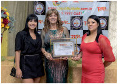
STYLUS CALÇADOS LOJA DE CALÇADOS 30 ANOS DE MERCADO 14 ANOS DE DESTAQUE (TROFÉU DE OURO) RUA 02 DE JULHO, 14 - CENTRO RUA MEM DE SÁ, 97 - VOMITAMEL FONE: (77) 3451-5088