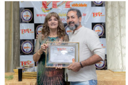
MOLAS SUDOESTE POSTO DE MOLAS 20 ANOS DE MERCADO 16 ANOS DE DESTAQUE (TROFÉU DE OURO) AV. BARÃO DO RIO BRANCO, 1.734 FONE: (77) 3451-4444 \ (77) 9.8802-0825