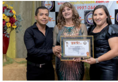
RESTAURANTE PREDILETTO MELHOR RESTAURANTE SELF SERVICE 09 ANOS DE MERCADO RUA DEOLINDA MARTINS, 286 - SANTO ANTONIO FONE: (77) 9.9153-0966 \ (77) 9.9173-5538