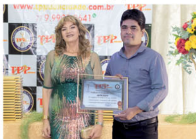
ARTSCREEN SERAGRAFIA E SINALIZAÇÃO 27 ANOS DE MERCADO 16 ANOS DE DESTAQUE (TROFÉU DE OURO) AV. OTÁVIO MANGABEIRA, 1.715 FONE: (77) 3451-4853 \ (77) 9.9978-8899