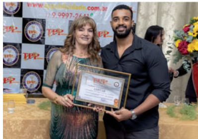
CONTAR CONTABILIDADE, CONSULTORIA PÚBLICA E PRIVADA 47 ANOS DE MERCADO 23 ANOS DE DESTAQUE (TROFÉU DE OURO) RUA ATÍLIO PEREIRA DE OLIVEIRA, 453 FONE: (77) 3451-1562