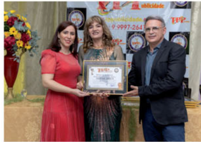
INOVAR DESIGN LOJA DE MÓVEIS ALTO PADRÃO 10 ANOS DE MERCADO 04 ANOS DE DESTAQUE (CHAVE DE OURO) AV. BARÃO DO RIO BRANCO, 1.046 - SÃO FRANCISCO FONE: (77) 3451-7820 \ (77) 9.9111-2693