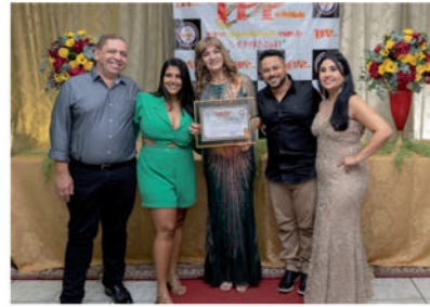
AUTO ESCOLA NOVA MODELO AUTO ESCOLA 17 ANOS DE MERCADO 14 ANOS DE DESTAQUE (TROFÉU DE OURO) RUA GUANABARA, 126 - CENTRO FONE: (77) 3451-1015 \ (77) 9.9174-0001