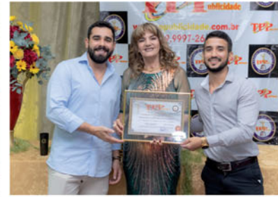
PUBLICOUNT CONTABILIDADE PÚBLICA ASSESSORIA E CONTABILIDADE 30 ANOS DE MERCADO 14 ANOS DE DESTAQUE (TROFÉU DE OURO) RUA ATÍLIO PEREIRA DE OLIVEIRA, 453 - CENTRO FONE: (77) 3451-1562