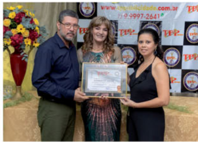
CONSULTH SAÚDE CLÍNICA DE PSICOLOGIA E SAÚDE MENTAL 21 ANOS DE MERCADO 12 ANOS DE DESTAQUE (TROFÉU DE OURO) PRAÇA DA BANDEIRA, 44 - CENTRO FONE: (77) 3452-0824 \ (77) 9.9907-2611