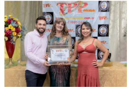
WIZARD IDIOMAS MELHOR CURSO DE IDIOMAS 07 ANOS DE MERCADO 04 ANOS DE DESTAQUE (CHAVE DE OURO) RUA 1º DE MAIO, 52 - CENTRO FONE: (77) 3452-2195 \ (77) 9.9979-8767