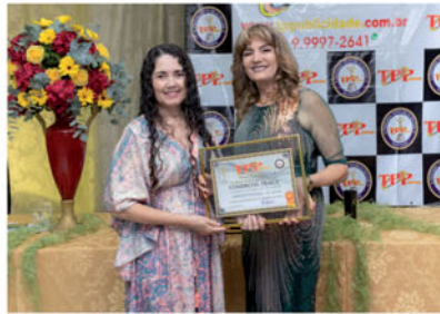
COMERCIAL FRAGA - DISTRIBUIDORA DE EMBALAGENS PLÁSTICAS E TEMPEROS EM GERAL 36 ANOS DE MERCADO 10 ANOS DE DESTAQUE (TROFÉU DE OURO) PRAÇA JACINTO LOBO - CENTRAL DE ABASTECIMENTO GALPÃO, 130 - ALA - A BLOCO 15 E 17 FONE: (77) 9.8829-3243