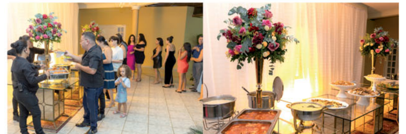
Jantar preparado pelo Restaurante "O Favoritto".