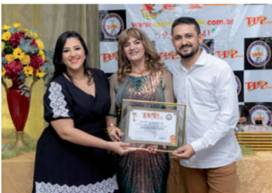
DELTA SOLARES ENERGIA SOLAR 06 ANOS DE MERCADO 02 ANOS DE DESTAQUE (CHAVE DE OURO) RUA NOVA OLINDA, 242 - SÃO JOSÉ FONE: (77) 9.9996-8110