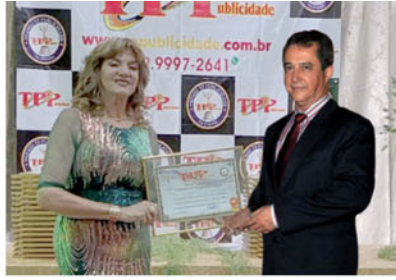
CME - CENTRO MÉDICO ESPECIALIZADO CLÍNICA DE ESPECIALIDADE MÉDICA 08 ANOS DE MERCADO 06 ANOS DE DESTAQUE (CHAVE DE OURO) PRAÇA JOSÉ FERREIRA, 22 - CENTRO FONE: (77) 3451-2198