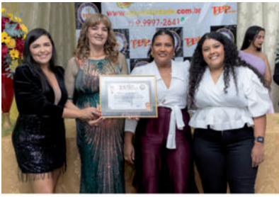
LOJAS FLOR DE CACTO LOJAS DE PRODUTOS DE BELEZA E LOJAS ESPECIALIZADA NA BELEZA MAIS DE 02 NOS DE MERCADO RUA CORONEL PEDRO FRANCISCO DE MORAES, 70 CENTRO - FONE: (77) 9.8849-4124