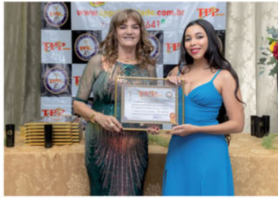
BASTOS E SOUZA CORRETORA DE IMÓVEIS IMOBILIÁRIA 16 ANOS DE MERCADO 14 ANOS DE DESTAQUE (TROFÉU DE OURO) RUA 13 DE MAIO, 326 - CENTRO FONE: (77) 3451-0601 \ (77) 9.9117-6038