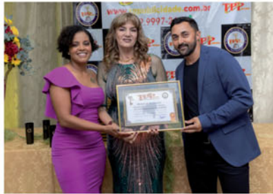
EXCLUSIVE ESQUADRINHAS DE ALUMÍNIO ESQUADRINHAS DE ALUMÍNIO 08 ANOS DE MERCADO 04 ANOS DE DESTAQUE (CHAVE DE OURO) TRAV. MAURA GOMES BARROS, 105 - SANDOVAL BARROS FONE: (77) 9.9951-9280 \ (77) 9.8141-7231