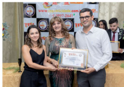
HOSPITAL DE OLHOS GUANAMBI HOSPITAL DE OLHOS 09 ANOS DE MERCADO RUA JOÃO RODRIGUES DE CARVALHO, 320 SÃO FRANCISCO FONE: (77) 3451-9096 \ (77) 9.9902-3079