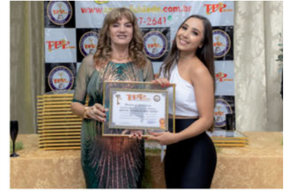
BIENAL - "COLÉGIO QUI-MIMO" MELHOR ENSINO MÉDIO 07 ANOS DE MERCADO 05 ANOS DE DESTAQUE (CHAVE DE OURO) RUA 13 DE MAIO, 222 - CENTRO FONE: (77) 3451-2650