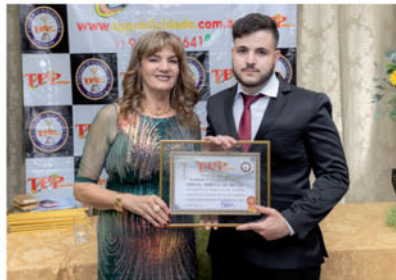
JORNAL TRIBUNA DO SERTÃO JORNAL REGIONAL 38 ANOS COM VOCÊ 23 ANOS DE DESTAQUE (TROFÉU DE OURO) RUA VALDOMIRO ALVES LUZ, 35 - BRUMADO-BA FONE: (77) 3441-7634 \ (77) 9.9962-8581