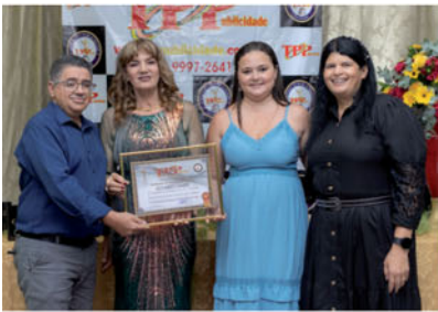
GUARECOMPE - REVENDAS DE PNEUS NOVOS, RECAPAGEM DE PNEUS, ALINHAMENTO E BALANCEAMENTO DE VEÍCULOS LEVES E PESADOS 47 ANOS DE MERCADO 13 ANOS DE DESTAQUE (TROFÉU DE OURO) AV. OTÁVIO MANGABEIRA, 296 - CENTRO FONE: (77) 3451-1244