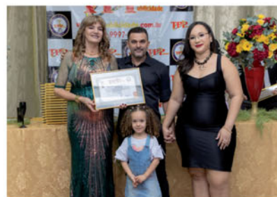
PIZZARIA Q GAROTO - PIZZARIA 12 ANOS DE MERCADO 07 ANOS DE DESTAQUE (CHAVE DE OURO) RUA BEJAMIM VIEIRA COSTA, 275 - SÃO FRANCISCO RUA MANOEL COTRIM, 168 - ALVORADA FONE: (77) 9.8105-5007