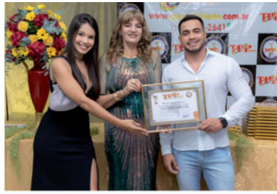
FLEX SUPLEMENTOS LOJA DE SUPLEMENTOS 05 ANOS DE MERCADO AV. GUANABARA, 104 - CENTRO FONE: (77) 9.9104-1673 \ (77) 9.9130-3388