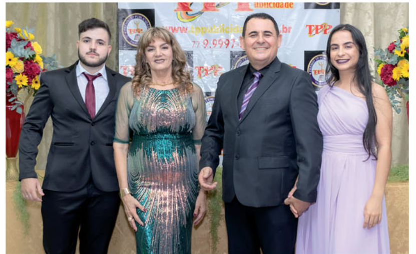
Equipe TP Publicidade.

No evento, muitas empresas e profissionais além de receberem seus certificados, foram agraciados com a impressão dos selos, de acordo com o acúmulo de destaques por anos consecutivos como: Chave de Ouro por mais de dois anos de destaque e o Troféu da Vitória Alada, símbolo internacional da qualidade