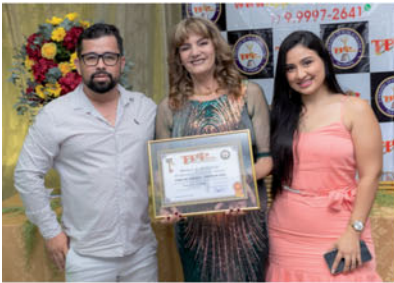
CASA DE CARNES PREMIUM GRILL CASA DE CARNES 05 ANOS DE MERCADO AV. SANTOS DUMONT, 725 BAIRRO AEROPORTO VELHO