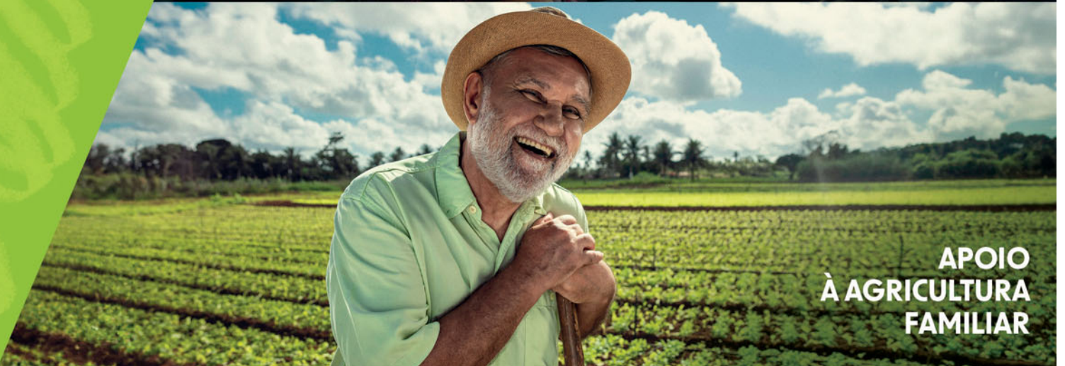
APOIO À AGRICULTURA FAMILIAR