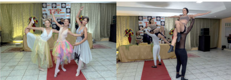
Balé e Teatro Casa Cultural Iana Rocha.