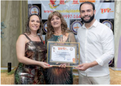
CARMEN STEFFENS EXCELÊNCIA NO ATENDIMENTO E MELHOR LOJA DE FRANGUIA 09 ANOS DE MERCADO 06 ANOS DE DESTAQUE (CHAVE DE OURO) AV. SANTOS DUMONT, 745 FONE: (77) 3451-4978